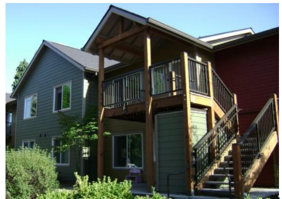
Villa de Sueños, a una propiedad Hacienda.

¿Qué sucede cuando las personas integran la limpieza no tóxica en sus vidas? En el otoño/invierno de 2020, se llevaron a cabo grupos focales en persona y encuestas bilingües en línea con distanciamiento social en las comunidades de vivienda de Hacienda CDC para averiguarlo. COVID-19 afectó particularmente a la comunidad latina/ x, y el aumento de los niveles de desinfección aumentó la exposición de las familias y los niños a docenas de diferentes productos químicos tóxicos (es decir, lejía) en sus productos. No debe ser una carga de costos obtener productos de limpieza y cuidado personal ambientalmente saludables, no tóxicos y sostenibles. Al escuchar y aprender de los residentes de Hacienda sobre sus comportamientos de compra con respecto a los productos de limpieza e higiene personal, 75 residentes participaron en grupos focales o encuestas en línea. 1 Con esa información, se nos ocurrieron recetas asequibles de limpieza y desinfección en español e inglés y kits caseros ecosalida a medida con ingredientes no tóxicos, y los distribuimos a estos residentes. Luego encuestamos a los participantes por segunda vez en la primavera / verano de 2021 después de que tuvieron la oportunidad de usar sus kits caseros ecosalida. Este informe muestra un resultado positivo significativo en la salud de los residentes. 2